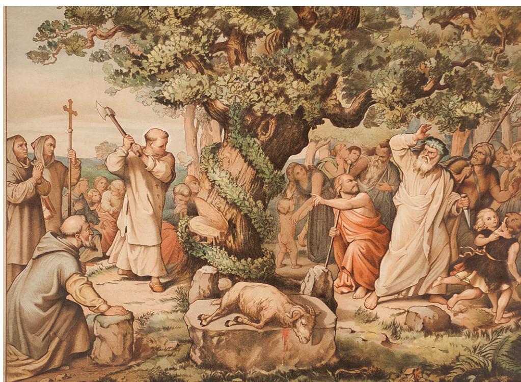
Schoolplaat van Bonifatius