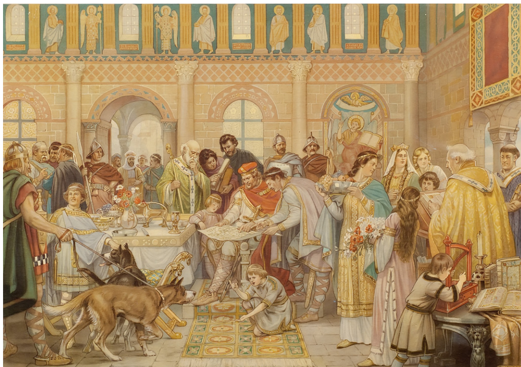
Schoolplaat Aan het hof van Karel de Grote

Karel de Grote (742-814) zorgde dat hier verandering in kwam; alle jongens moesten naar school. Karel de Grote regeerde van 768 tot 814 over het grote Frankische rijk. Voor het besturen van zijn land maakte Karel de Grote gebruik van de monniken, priesters en edellieden die konden lezen en schrijven. De rest van de bevolking was in deze tijd analfabeet.