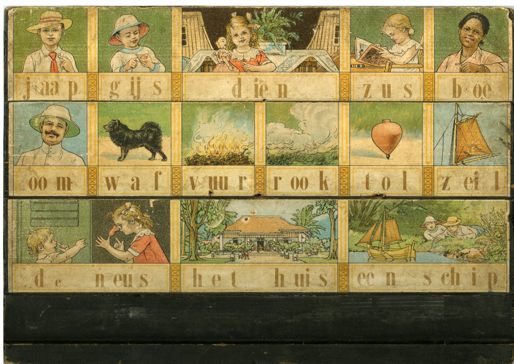
Indisch leesplankje, Collectie Nationaal Onderwijsmuseum, Dordrecht.

Het leesplankje en de vertelselplaat werden aangepast aan de mode van de tijd. Voor de leerlingen in de voormalige kolonie Nederlands-Indië werd er een speciaal leesplankje gemaakt. Dit plankje begon met de woorden jaap gijs dien.