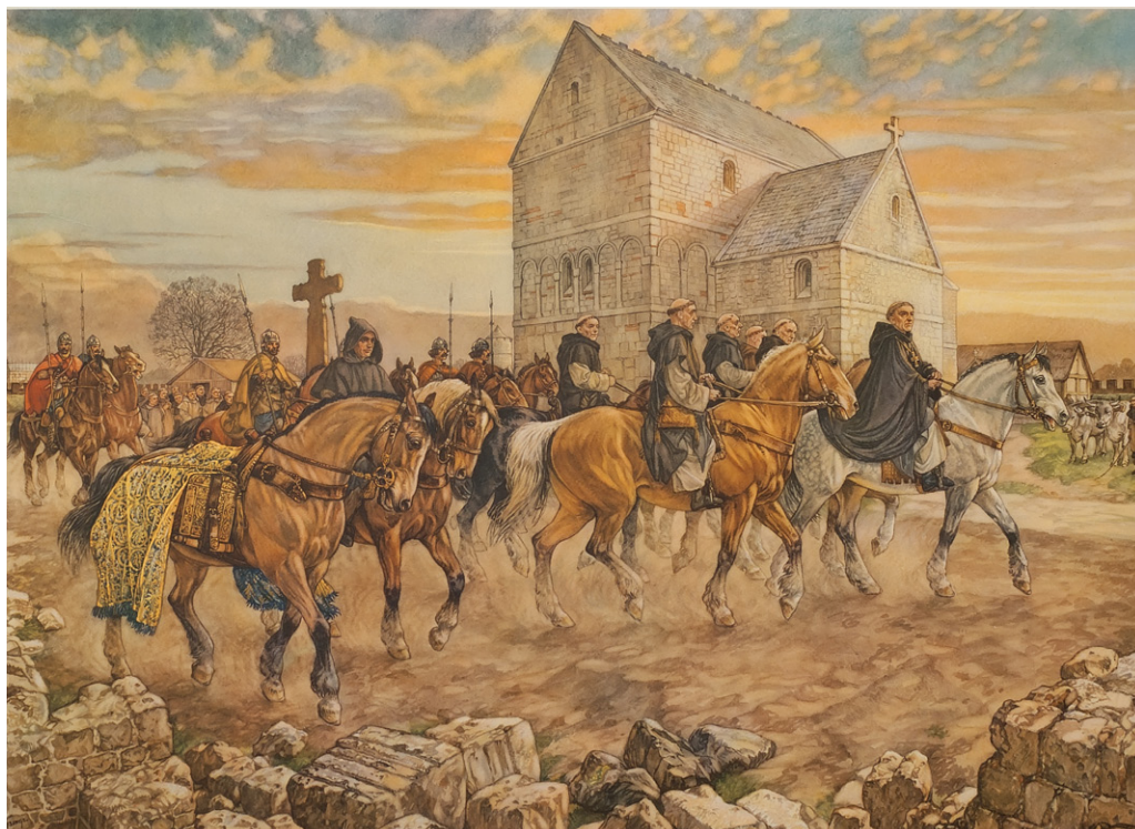
Schoolplaat Willibrord, De apostel der Friezen

Over de eerste scholen in Nederland is vrij weinig bekend. Waarschijnlijk zijn deze in de middeleeuwen opgezet naar het voorbeeld van de Engelse kloosterscholen die al in de zevende en achtste eeuw bestonden. Twee missionarissen uit Engeland, Willibrordus en Bonifatius, reisden onder andere naar Nederland af om het Christelijke geloof te prediken. Zij namen in Nederland jongens in de leer om hen te helpen bij het missiewerk.