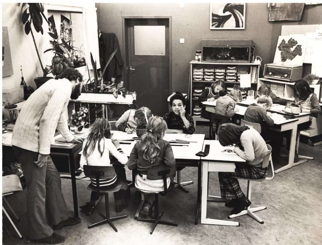
Een klaslokaal rond 1960, Collectie Nationaal Onderwijsmuseum, Dordrecht.

De traditionele klas met de achter elkaar geplaatste tweezitsbanken maakte plaats voor een losser schoolsysteem: iedere leerling kreeg een eigen tafeltje met stoeltje, waarmee groepjes konden worden gemaakt.