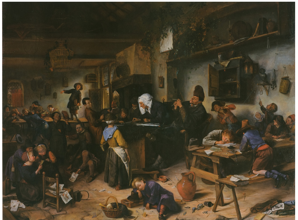
Schilderij De dorpsschool , Schilder Jan Steen, Collectie National Gallery of Scotland, Edinburgh

In de zeventiende eeuw zaten jongens en nu ook meisjes van alle leeftijden door elkaar. Van een echt schoolgebouw was nog geen sprake. Leerlingen kregen bijvoorbeeld les in de schuur of stal van de leraar.