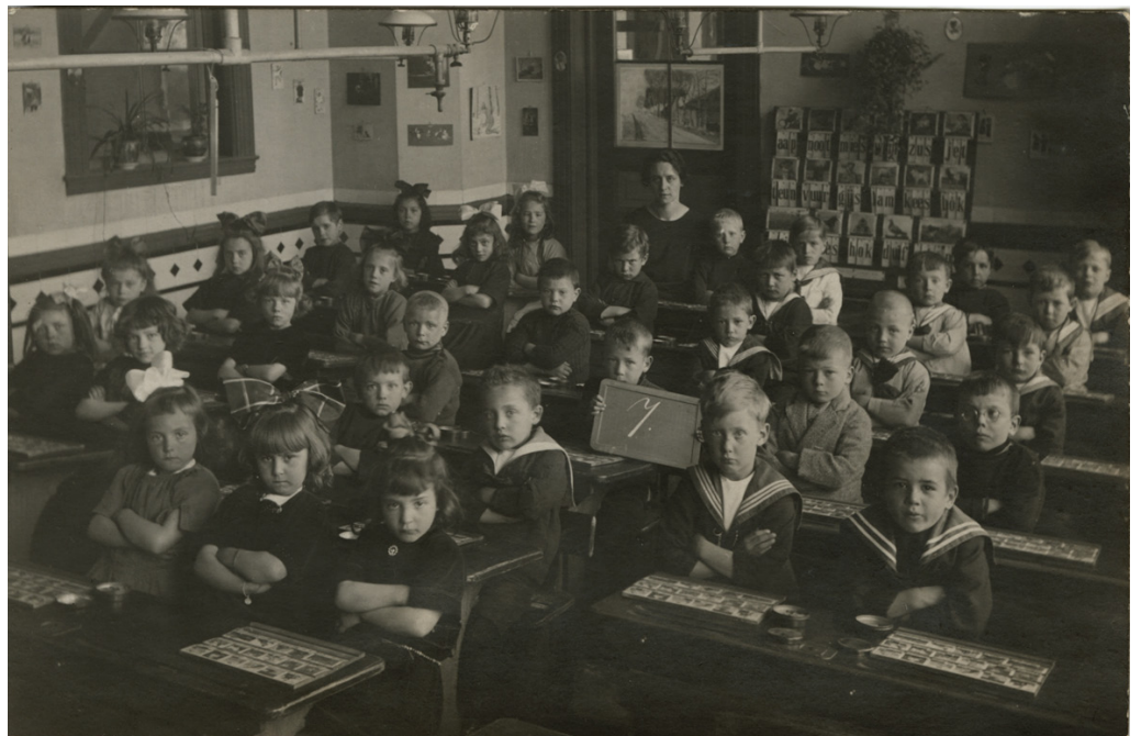
Een klaslokaal rond 1910.

Veel schoolkinderen leerden vanaf 1910 lezen met het leesplankje aap noot mies, de bijbehorende vertelselplaat, het letterdoosje, het leesboekje en het klassikale leesbord.